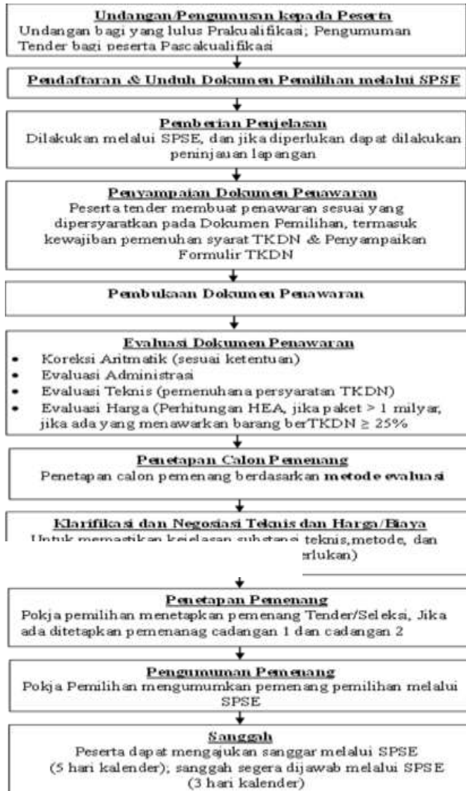
Gambar 3. Alur Proses Pemilihan Penyedia Barang/Jasa Pemerintah