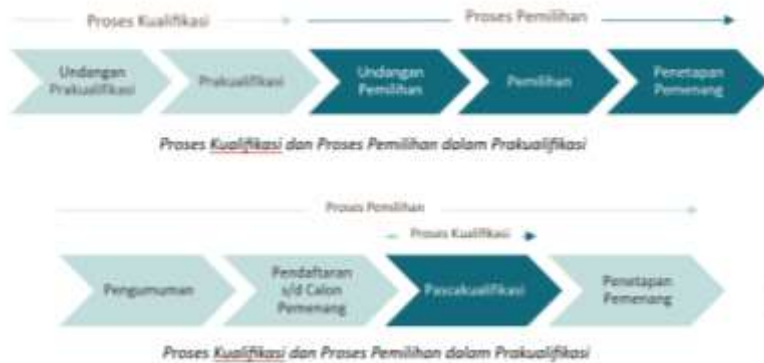
Gambar 2. Proses Pemilihan Penyedia dengan Tender/Seleksi

Penjadwalan proses pemilihan disusun oleh pokja dengan mempertimbangkan metode penyampaian dokumen penawaran, metode kualifikasi, waktu yang cukup untuk proses evaluasi juga ketentuan mengenai pengumuman dan juga penanganan sanggah.